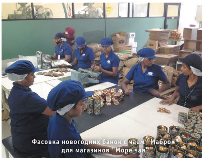
Фасовка новогодних банок с чаем Маброк для магазинов «Море чая»

Плантационный чай. В 2013 году Маброк представил ценителям плантационные чаи в деревянных шкатулках. Это одновременно и изысканный напиток (не купажируемый чай с одной из лучших плантаций Маброк) и красивый необычный подарок. Шкатулка снабжена плотно задвигающейся крышкой.