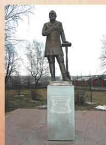
Александр Чудок (По материалам Википедии).

Ну и кстати к праздникам. Именно в фирме Губкина в одной из первых начали фасовать чай в подарочные банки. Так что «ИЗБРАННОЕ ИЗ МОРЯ ЧАЯ» продолжает традицию, которой почти 200 лет.