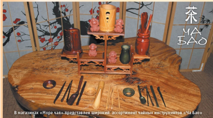
В магазинах «Море чая» представлен широкий ассортимент чайных инструментов «Ча Бао»