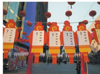
К празднику украшают улицы символики Нового года.