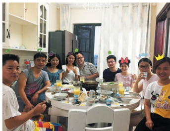
В первый день Нового года в Китае принято ходить в гости.

До изобретения хлопушек и петард шумели тем, что оказалось под рукой. В ход шли предметы домашней утвари. В 14 веке появился обычай сжигать в печи бамбуковые палочки, которые издавали сильный треск при сгорании.